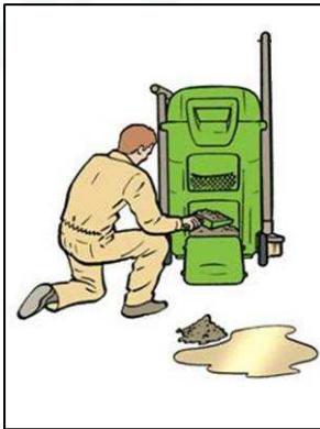
Facilité de Stockage et de Distribution