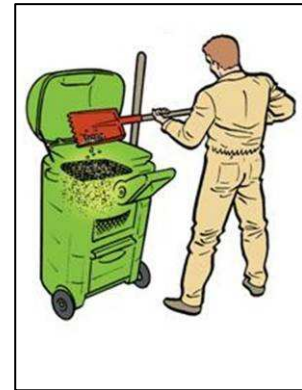
Collecte et Recyclage Rapide